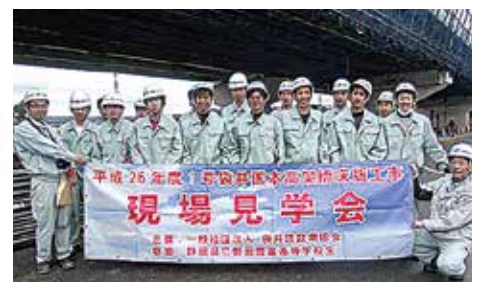
現場見学会に参加した磐田農高生