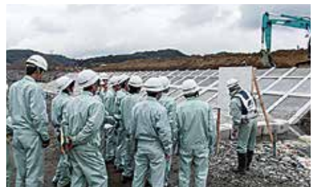
天竜川護岸・低水護岸工区見学