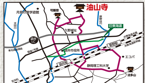
遠州三山 自分巡礼の旅 案内図(袋井市観光協会)より引用

塔の高さは18.25m、相輪を含めた高さは23.88m。相輪は水煙でなく宝瓶の形をした珍しいもので、桃山期の姿を今に伝えています。滋賀県の長命寺、京都府の宝積寺の三重塔とともに桃山の三名塔の一つに数えられています。静岡県最古の塔で国の重要文化財に指定されています。