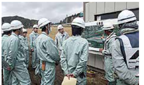
天竜川護岸・工事概要の説明を受ける