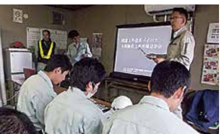
袋井バイパス・床版工事概要の説明を受ける