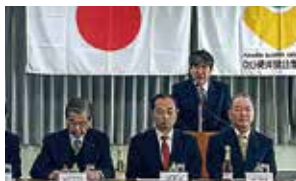
袋井土木事務所長挨拶