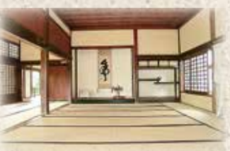
御書院上の間(殿様と客が対面する部屋)