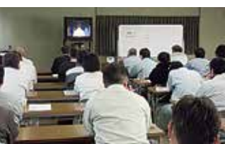
監理技術者TV講習会