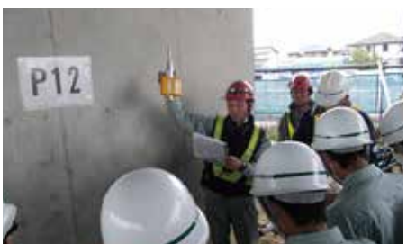
テストハンマーによるコンクリート圧縮強度測定を実習