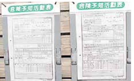
(株)アキヤマが実施中のKY(危険予知)活動表