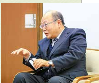
アンダーパス開通後のまちの様子について話を聞く戸塚副会長

「市長」 菊川市でも、災害協定を菊川市の建設業組合と結び、災害時には地元業者の皆さんに対応して頂けるようになら