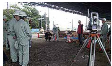
GPS、自動追尾、3次元設計データ活用の最新測量機器の操作デモ