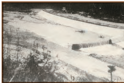
昭和16年、東大谷川の堰 このように近代工法によって、上流の水害 を防ぐ努力をした。