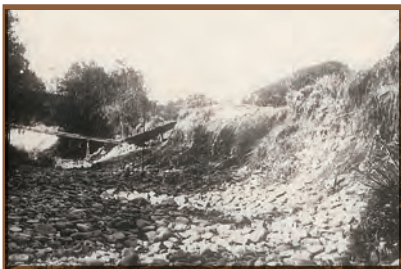
昭和7年、東大谷川決壊 東大谷川橋上流が切れ、堤防西側に決壊、 雨垂の橋が流失した。