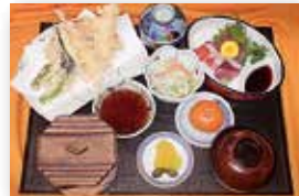
和風定食 ¥1,944 お刺身、天ぷら、ふたもの、季節のフルーツ付き