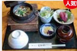
とら釜めし定食 ¥1,080 サラダ、小鉢、みそ汁、漬物付き

釜めしはペロリと完食してしまいます。定食にはお刺身やサラダもついているので満足です。 また、人の集まる席のお料理に役に立ちたいと仕出し料理やお弁当の販売もしているようです。目的や予算に応じて作ってくれるのでとても便利です。 宴会料理もありますので、ぜひ忘新年会にいかがですか？