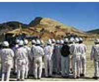
豊沢工業団地整備