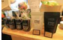
[2961ブレンド] 150g 900円 [ピターブレンド] 150g 900円