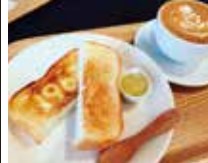
カフェモカ520円 ジャム&マーガリン350円

所在地:袋井市山名町3-3 TEL:080-3937-2961 営業時間 9:00~17:00 定休日:火曜日