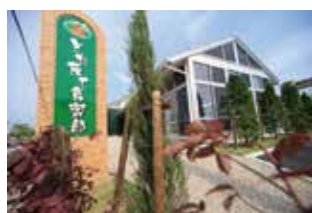
農産物直売所「とれたて食楽部」 安心安全な食材を取り扱うファーマーズマーケットです。