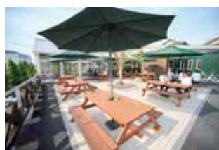
フードコートテラス ここは、ペット可ですので、愛犬家の皆さんに喜ばれています。