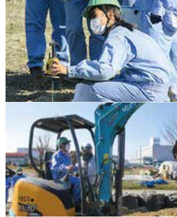
橋台工事(掛川市下垂木地先)