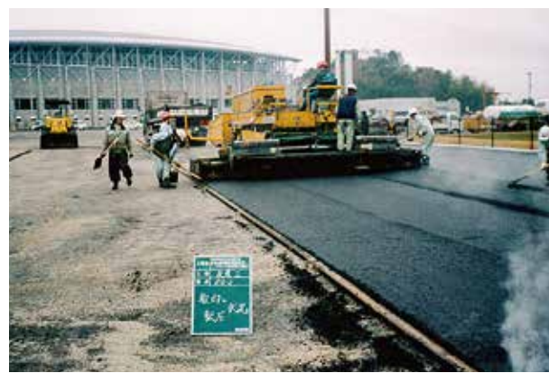
駐車場舗装工事中