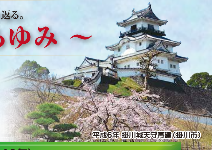
平成6年 掛川城天守再建(掛川市)

2019年5月に新元号となります。約30年間続いた平成の時代が終わり、新たな時代が始まります。今号から3回に分け、平成の時代に袋井建設業協会管内で造られた公共建造物を年表と共に振り返っていきたく思います。