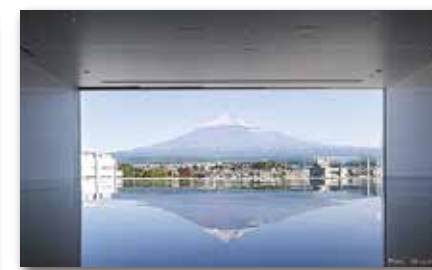
5階部分の床にも富士山がくっきり映されます