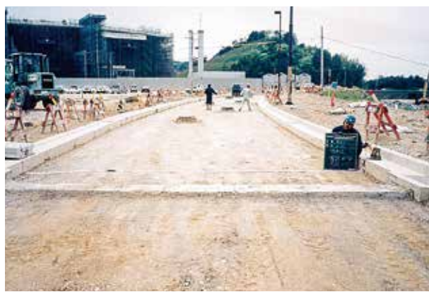
運動公園内道路工事中