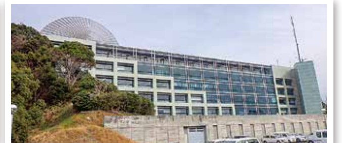
現在の掛川市役所本庁舎(平成31年2月撮影)