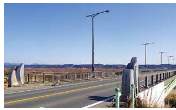
現在のかささぎ大橋(平成31年2月撮影)

天竜川に架かる浜北大橋、天竜川橋、新天竜川橋に渋滞緩和の為に建設された。浜松市笠井地区と磐田市匂坂に架かる橋ということで両地名から「かささぎ大橋」と名付けられた。