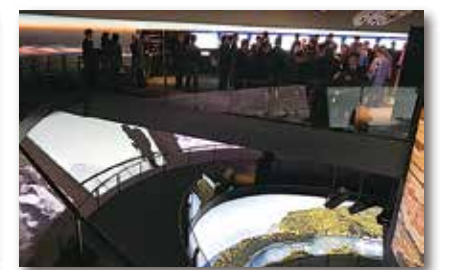
富士山疑似登山が体験できます