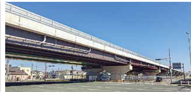
現在の袋井バイパス(堀越IC)(平成31年2月撮影)