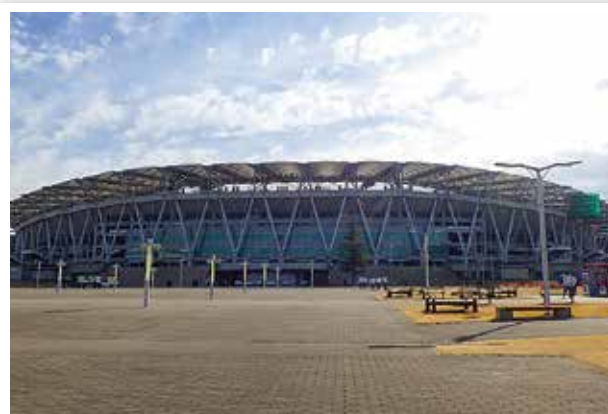
現在のエコパスタジアム

小笠山総合運動公園はスポーツ施設群を有する都市公園。面積は約270ha、総工費約800億円、平成13年(2001年)に供用開始された。平成14年(2002年)には2002FIFAワールドカップの準々決勝を含む3試合が開催され、本年(2019年)にはラグビーワールドカップ2019日本大会の3試合が行われる予定。