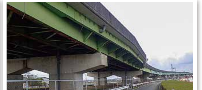
現在の袋井バイパス(国本付近)(平成31年2月撮影)

掛川市領家(沢田IC)から磐田市岩井(三ヶ野IC)間、総延長9.1kmを暫定2車線で開通した。総延長の半分以上が高架であり、国本~堀越間で90を超える橋脚により支えられている。現在は地震に備え、耐震補強工事が行われている。