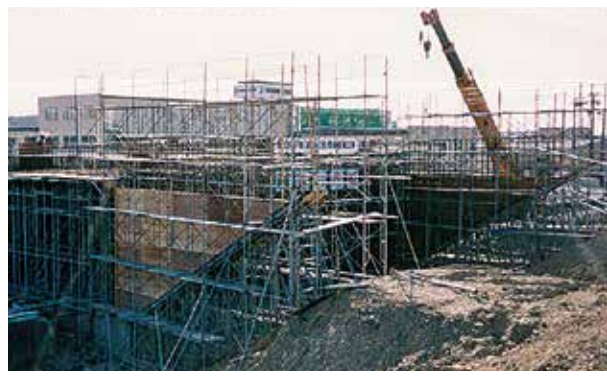
施工中のかささぎ大橋(A1橋台)完成前の橋名は笠井大橋であった。