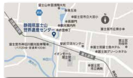
富士宮市宮町地内

世界の宝である富士山を後世に守り伝えるための拠点として静岡県が整備を進めてきた「静岡県富士山世界遺産センター」が完成し、平成29年12月にオープンしました。富士山を「深く究める」「広く交わる」をコンセプトに事業を幅広く展開していく。施設は、「逆さ富士」とも形容される独創的な形状となっている。「富士ヒノキ」を繊細に組み上げた壁面を持つ逆円錐形の施設の姿が、施設前面の水盤に富士山の形で映り込む。施設内の展示などを通じて富士登山を感じ、本物の富士山に出会い、世界遺産「富士山」について学ぶとともに、「富士山」を満喫する体験を提供し、世界遺産富士山の魅力や価値を発信する施設となります。