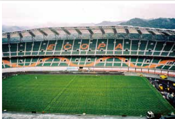
建設中のエコパスタジアム内